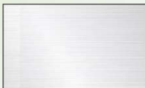
ステンレス(ヘアライン)